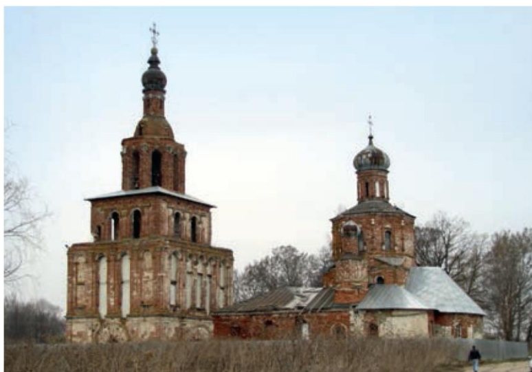
Раменский район, с. Степановское (церковный комплекс)

– Кроме ФЦП «Культура России (2012–2018 гг.)» Министерство культуры РФ реализует два крупных проекта со Всемирным банком – проект «Экономическое развитие Санкт-Петербурга», в рамках которого, например, велась реконструкция и реставрация Главного штаба Эрмитажа, и проект «Сохранение и использование культурного наследия в России», в рамках которого сейчас финансируются работы на парке «Монрепо», усадьбе «Приютино», Путевом дворце в Твери, памятниках в Новгородской и Псковской областях, будет построен многофункциональный музейный комплекс в Ленобласти. Еще один новый проект «Сохранение и развитие исторических поселений» находится в стадии подготовки и согласования критериев отбора участников проекта и стартует в 2014 году.