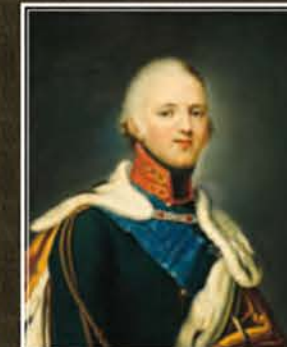
Портрет имп. Александра I Неизв. художник, 1-я пол. XIX в., х. м., ГМИ СПб