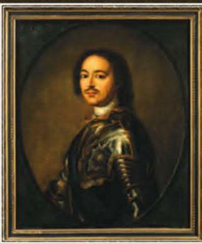
Портрет имп. Петра I Неизв. художник, сер. XVIII в., х. м., ГМИ СПб

Лето 2013 г. Открытие Царских комнат Петропавловского собора