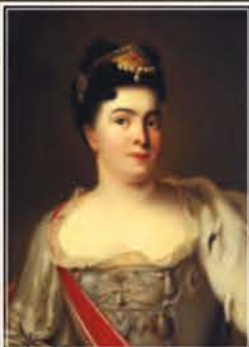
Портрет имп. Екатерины I Неизв. художник, кон. XVIII — нач. XIX вв., х. м., ГМИ СПб, копия с работы Ж.-М. Натье