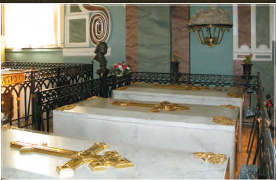
www.spbmuseum.ru Информационный центр Петропавловской крепости: тел. +7(812)230-6431