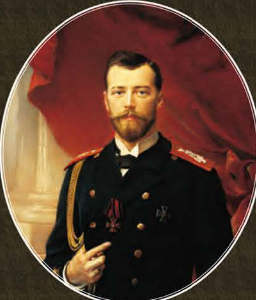
Портрет имп. Николая II Э. К. Липгарт, после 1910 г., х. м., ГМИ СПб