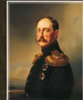
Портрет имп. Николая I Неизв. художник, 1852-55 гг., х. м., ГМИ СПб