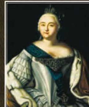
Портрет имп. Елизаветы Петровны Неизв. художник, 2-я пол. XVIII в., х. м., ГМИ СПб