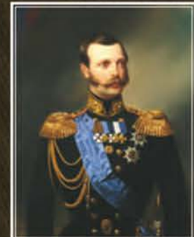
Портрет имп. Александра II Неизв. художник (Гебенс, Эбенс), 1879-88 гг., х. м., ГМИ СПб