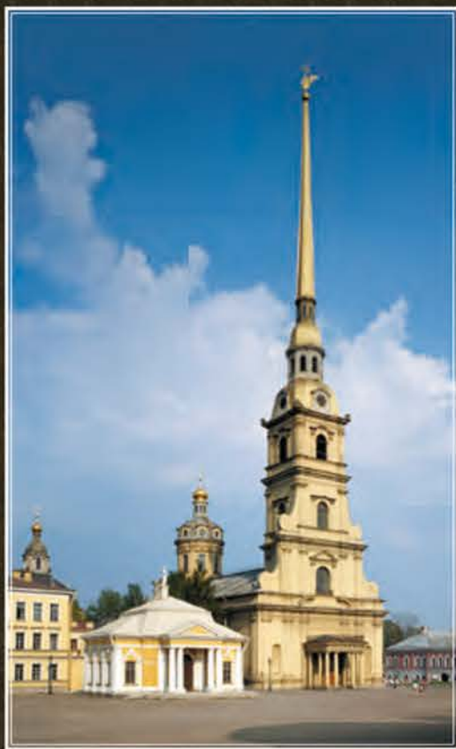
Материал о реставрации фасадов и иконостаса Петропавловского собора читайте на стр. 76

8 ноября 2013 — 8 октября 2014 гг. Выставка «Романовы в Петербурге» из фондов ГМИ СПб в Инженерном доме Петропавловской крепости